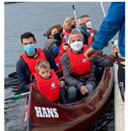
▲ De inhuldiging van het G-Kano-project aan het Schulensmeer.